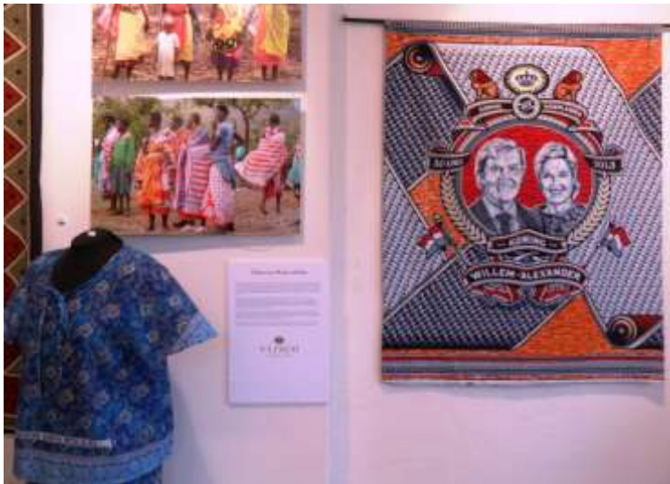
Vlisco, Afrika en de nieuwe Nederlands koning (TRC Afrika tentoonstelling)

Het enorme vasteland van Afrika wordt bewoond door een grote verscheidenheid aan culturele en etnische groepen, vaak met hun eigen stijlen van traditionele textiel en kleding. Al duizenden jaren worden deze verschillen gebruikt om de groep te onderscheiden van andere groepen, maar ook om de sociale en economische status van een persoon binnen de groep aan te geven. Behalve als teken van identiteit weerspiegelen kleding en textiel ook lokale ideeën en voorkeuren voor kleuren en patronen, en gevoelens van religie en spiritualiteit.