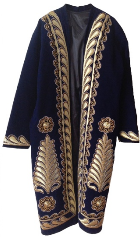
Jas versierd met gouddraad, uit Uzbekistan. TRC collectie.

De nieuwe TRC tentoonstelling over het gebruik van goud en zilver op textiel en kleding gaat open voor het publiek op maandag 1 februari, en blijft te zien tot 30 juni. De tentoonstelling omvat textiel en kleding dat is geborduurd, geveerd, bedrukt en geweven met goud- en zilveragekleurde draad of verf. De vele stoffen en kledingstukken die kunnen worden bewonderd dateren uit een periode van de dertiende eeuw tot het heden, en komen uit alle delen van de wereld. De tentoonstelling laat kledingstukken zien uit Afghanistan en Uzbekistan, maar ook bruiloftskleding uit India. Er is textiel uit Indonesië dat is geveerd of geweven met goud. Er zijn fluwelen en zijden stoffen uit Europa, liturgische kledingstukken, en met goud- en zilverdraad versierde hoofdkapjes uit Europa en Azië.