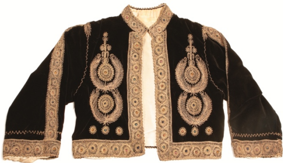
Geborduurd Bethlehem jase, TRC collectie

Ter gelegenheid van de aanstaande publicatie van de Encyclopedia of Embroidery from the Arab World (Bloomsbury, februari 2016), organiseert het TRC een speciale woensdagochtend workshop over Palestijns borduurwerk, en in het bijzonder het naaldwerk dat traditioneel wordt geassocieerd met Bethlehem. De deelnemers krijgen veel informatie over dit type borduurwerk, en worden ook aangemoedigd om zelf, onder deskundige begeleiding, wat Palestijns naaldwerk uit te proberen.